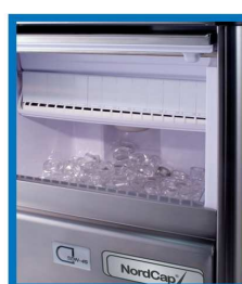
Einfache Reinigung des Pumpenfilters