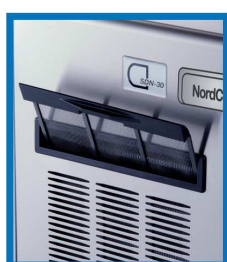
Luftfilter zum Schutz des Kondensators

Bei der Linie SDN sind Verdampferabdeckung, Pumpenschlauch und Sprühdosen durch die AGION-Technologie geschützt.